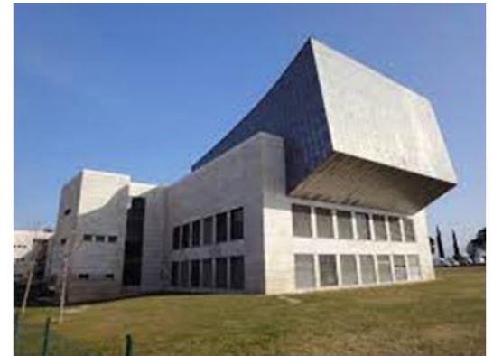
Escuela Politécnica Superior de Huesca (Polytechnic School of Huesca)