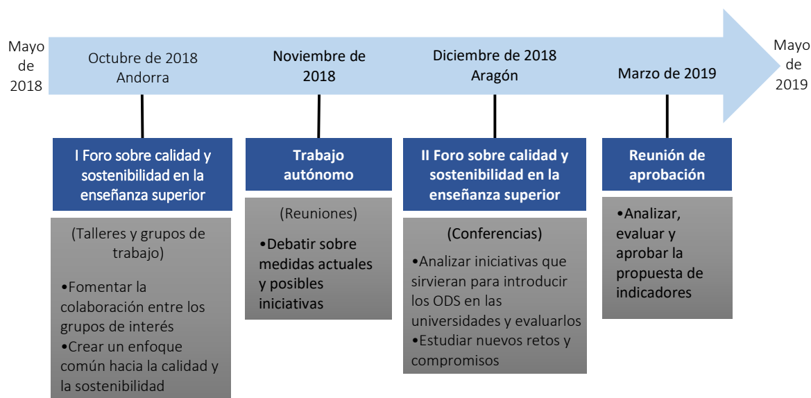
Gráfico 2: Cronograma del proyecto

El proyecto se desarrolló en las distintas etapas que se presentan en el gráfico 2.