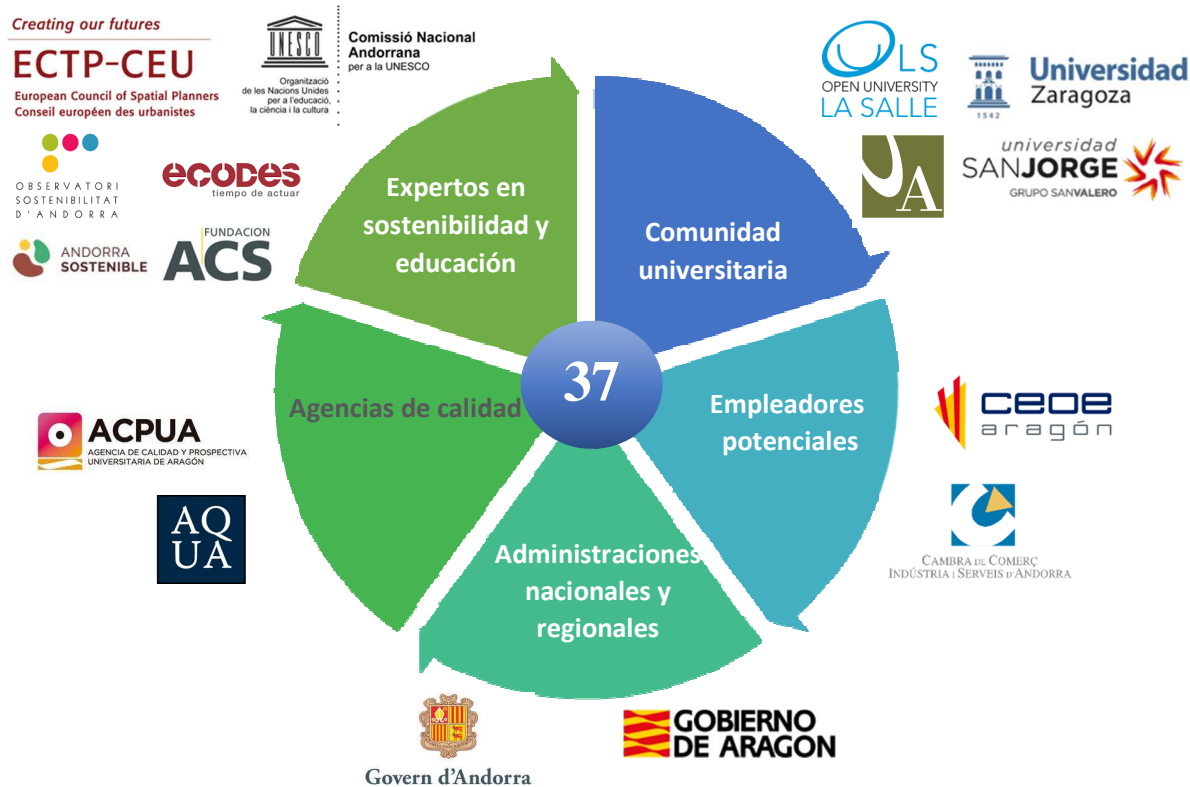
Gráfico 1 Participantes del proyecto

Los encargados de coordinar el proyecto fueron los directores de AQUA y ACPUA y para el desarrollo y el asesoramiento contaron con un comité internacional de expertos en sostenibilidad y calidad en la enseñanza superior integrado por: